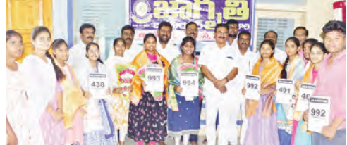
విద్యార్థులను సన్మానించిన మాజీ మంత్రి