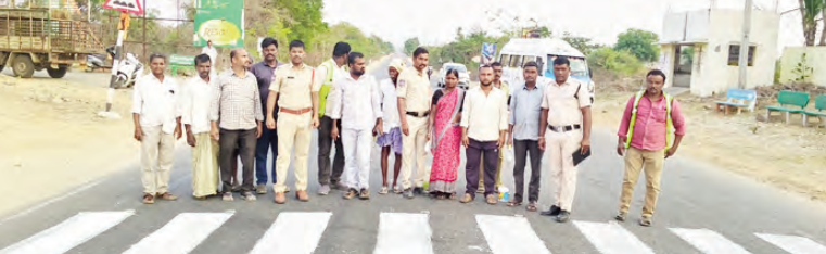
కేరాల హైదరాబాద్ ప్రధాన రహదారిలోని అయ్యలపల్లి స్టేజి వద్ద ప్రమాదాల నివారణ మార్గం ఇప్పటి వరకు.

ఉప్పుసంకల, ఏప్రిల్ 14 ప్రభాతవార్త: మండలంలో రద్దీ అధికంగా ఉన్న ప్రాంతాలను గుర్తించారు. రోడ్డు భద్రత కు ప్రాధాన్యత ఇస్తూ ఎన్ఐఎ వెంకట్ రెడ్డి అధ్యక్షులలో ప్రత్యేక చర్యలు చేపట్టారు. మంగళవారం మండలంలోని శ్రీశైల హైదరాబాద్ జాతీయ రహదారి పై ఉన్న అయ్యల వారి పల్లి స్టేజి వరదల్లో వాహనాల రద్దీ అధికంగా ఉండడంతో పాటు తరచుగా జరుగుతున్న ప్రమాదాలు వోటు చేసుకుంటూన్న ప్రాంతాన్ని గుర్తించామని ఎమ్మెల్యే వెంకట్ రెడ్డి తెలిపారు. ఆ ప్రాంతంలో జిల్లాకానిగ్ పూర్తిగా నిలిచిపోవడంతో పాతకాలకు ఇబ్బందులు ఏర్పడుతున్నాయని గమనించి, వెంకట్ ఆ ప్రాంతంలో తెల్లటి పెయింటింగ్ చేసి జిల్లా క్రాసింగ్ ను పునరుద్ధరించామని ఆయన పేర్కొన్నారు. దీంతో ప్రజలు, వాహన ఛోదకులు రోడ్డు సురక్షితంగా దాటించుకునే వీలుంటుందన్నారు. అర్చన అర్చన కార్యక్రమంలో భాగంగా గ్రామస్థులు, ప్రయాణికులకు రోడ్డు భద్రతపై అవగాహన కల్పించామని, ట్రాఫిక్ నిబంధనలు తప్పనిసరిగా పాటించాలని ఎన్ఐఎ సూచించారు. పాల్వెళ్లి, సీటు జెల్లు మినియోగం, అపరిమితమైన వేగం తో వాహనాలు నడవడం ద్వారా ప్రమాదాలను తగ్గించవచ్చని ఎమ్మెల్యే పేర్కొన్నారు. ప్రజల ప్రాణ భద్రత ప్రధాన లక్ష్యమని, ప్రమాదాల నివారణ కోసం ఇలాంటి కార్యక్రమాలు నిరంతరం కొనసాగిస్తామని ఎమ్మెల్యే అన్నారు.