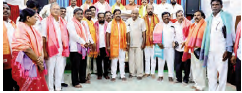
కైస్తవ సోదరులతో అచ్చంపేట ఎమ్మెల్యే డా. చిక్కూడు వంశీకృష్ణ

అచ్చంపేట, ఏప్రిల్ 14 ప్రభాతవార్త: నియోజకవర్గంలోని క్రైస్తవుల పాస్టర్ల సమన్వయ పరిషత్తుకు కృషి చేస్తానని అచ్చంపేట శాసనసభ్యులు వంశీకృష్ణ పేర్కొన్నారు. మంగళవారం పట్టణంలోని శాలి ఎ.వి. చర్చి ఆవరణలో నియోజక వర్గంలోని సూతన పాస్టర్ల కమిటీ ని సన్మానించారు. అచ్చంపేట క్రైస్తవ వెల్ఫేర్ సొసైటీ అధ్యక్షులలో జరిగిన కార్యక్రమంలో ఎమ్మెల్యే మాట్లాడుతూ నియోజకవర్గంలోని క్రైస్తవులు పాస్టర్ల ఎదుర్కొంటున్న ప్రతి సమస్యను పరిష్కరించడానికి కృషి చేస్తానని పేర్కొన్నారు. ప్రభుత్వ పరంగా వ్యక్తిగతంగా వారికి తమ సహకారం ఎప్పుడూ ఉంటుందని అన్నారు. వారి సమన్వయ పరిషత్తుకు 24 గంటలు తన అందుబాటులో ఉంటానని వారు ఏ రాత్రి అయిన సమన్వయ కోసం తమ వద్దకు రావచ్చునని అన్నారు. నియోజకవర్గంలోని చర్చిల నిర్మాణం పాస్టర్లకు ఇందిరమ్మ ఇండ్లు తోపాటు అన్ని ప్రభుత్వ పథకాలలో అవకాశం కల్పిస్తామని అన్నారు. ప్రస్తుత కమిటీ ద్వారా కార్యక్రమాలు నిర్వహించుకోవాలని వారి అధ్యక్షులలోని అభిప్రాయం క్రైస్తవులను కొనసాగించాలని సూచించారు. పాస్టర్ల క్రైస్తవుల ప్రభుత్వమే ఈ ప్రభుత్వం కలిగి వారి సహకారం ద్వారా ఎప్పుడూ ఉంటానని ఆయన కోరారు. ఈ సందర్భంగా ఎమ్మెల్యే సూతన పాస్టర్ల కమిటీని ఘనంగా సన్మానించారు అది విధంగా పాస్టర్ల కమిటీ అధ్యక్షులలో