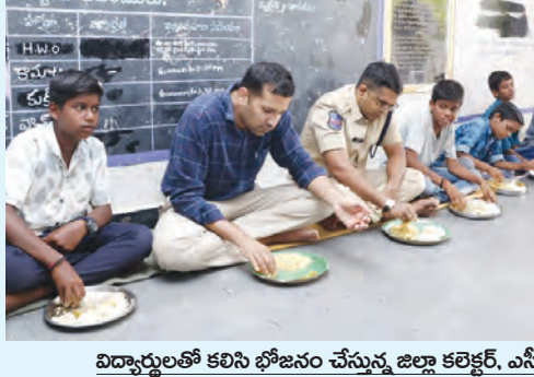
విద్యార్థులతో కలిసి భోజనం చేస్తున్న జిల్లా కలెక్టర్, ఎస్సీ